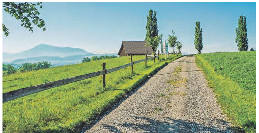
Blick auf die Rigi kurz nach dem Aufbruch in Sins.

Je nach Frage und Perspektive ergeben sich verschiedene Antworten oder auch neue Fragen. Entscheidend ist, dass man mit offenen Augen und Neugier die von den Menschen gestalteten Wegmarken in der Landschaft befragt. Diese Wegmarken sind dabei durchaus im wörtlichen Sinn zu sehen wie Zollstätten an Brücken oder aber im übertragenen Sinn als Symbole für eine konservative oder liberale Wirtschaftspolitik: Warum führt eine Strasse genau hier durch und nicht dort? Wozu erhob man an den Brücken bis 1847 Zölle? Welche Interessen führten dazu, dass im 19.