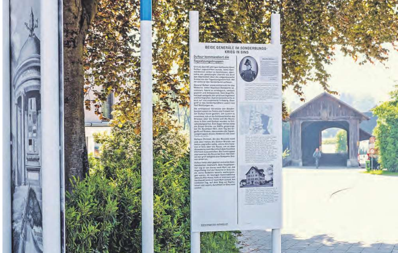
Die Holzbrücke in Sins als geschichtsträchtiger Ausgangspunkt des Wegs.

Die moderne Schweiz ist nicht direkt und geradlinig aus ihrer Geschichte hervorgegangen, sondern hat zahlreiche Schlaufen und Irrwege durchgemacht und hätte dabei oft andere Wege einschlagen können, bis sie schliesslich zu dem staatlichen Gebilde geworden ist, das wir heute kennen. Diese Wege verliefen teilweise parallel, teilweise holprig und steinig und sind ja bis heute keineswegs an einem Zielpunkt angelangt. Der Verein «Wege zur Schweiz» will zeigen, dass Schweizer Geschichte wie jede Geschichte vielschichtig und mehrdimensional ist. Wege müssen dabei nicht immer als begehbarer Pfad und Strassen gedacht werden, sondern können auch Gedanken- oder Entscheidungswege sein. Niklaus von Flües «Machet den Zaun nicht zu weit» kann dabei ebenso eine Wegmarke bilden