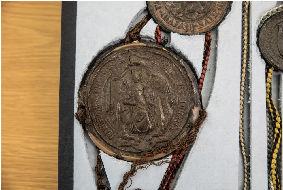
Das Siegel des französischen Königs.

Bild: Manuela Jans-Koch (Luzern, 30. April 2021)